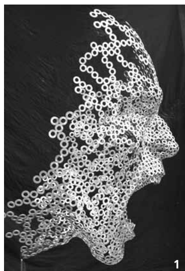
1/ LE CRI , 2016, 1,5 m x 1 m, acier Inoxydable, collection particulière.

Consultez www.christian-burger.com et aussi www.sculpture-evenement.com