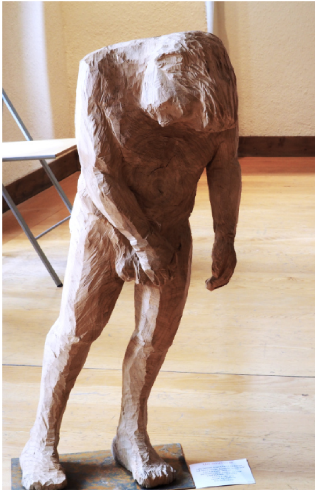
« Un souvenir » cèdre 100x36x25, socle métal 1900€