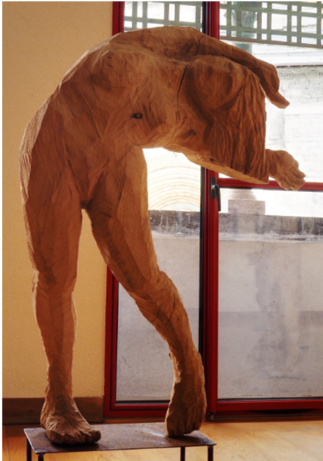
«La femme arc en ciel» cèdre, 100x70x20, socle en métal rehaussé 28cm, 1900€