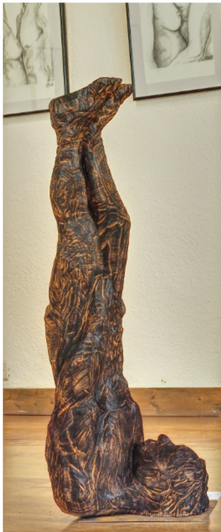
«Le Songeur» cèdre brûlé, 98x32x30 socle métal, 1900€

Le Songeur Le songe est le rêve bleu La mésange un ange qui danse qui pleut Le songe est un rêve marin d'où la vague reflète le synopsis d'un cliché et s'en va