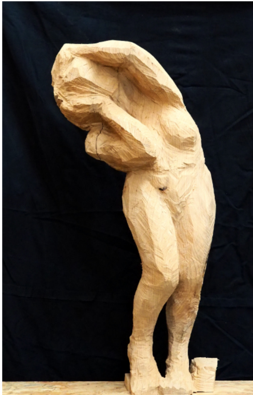
« Soucieuse » cèdre 97x42x26, socle métal 1900€