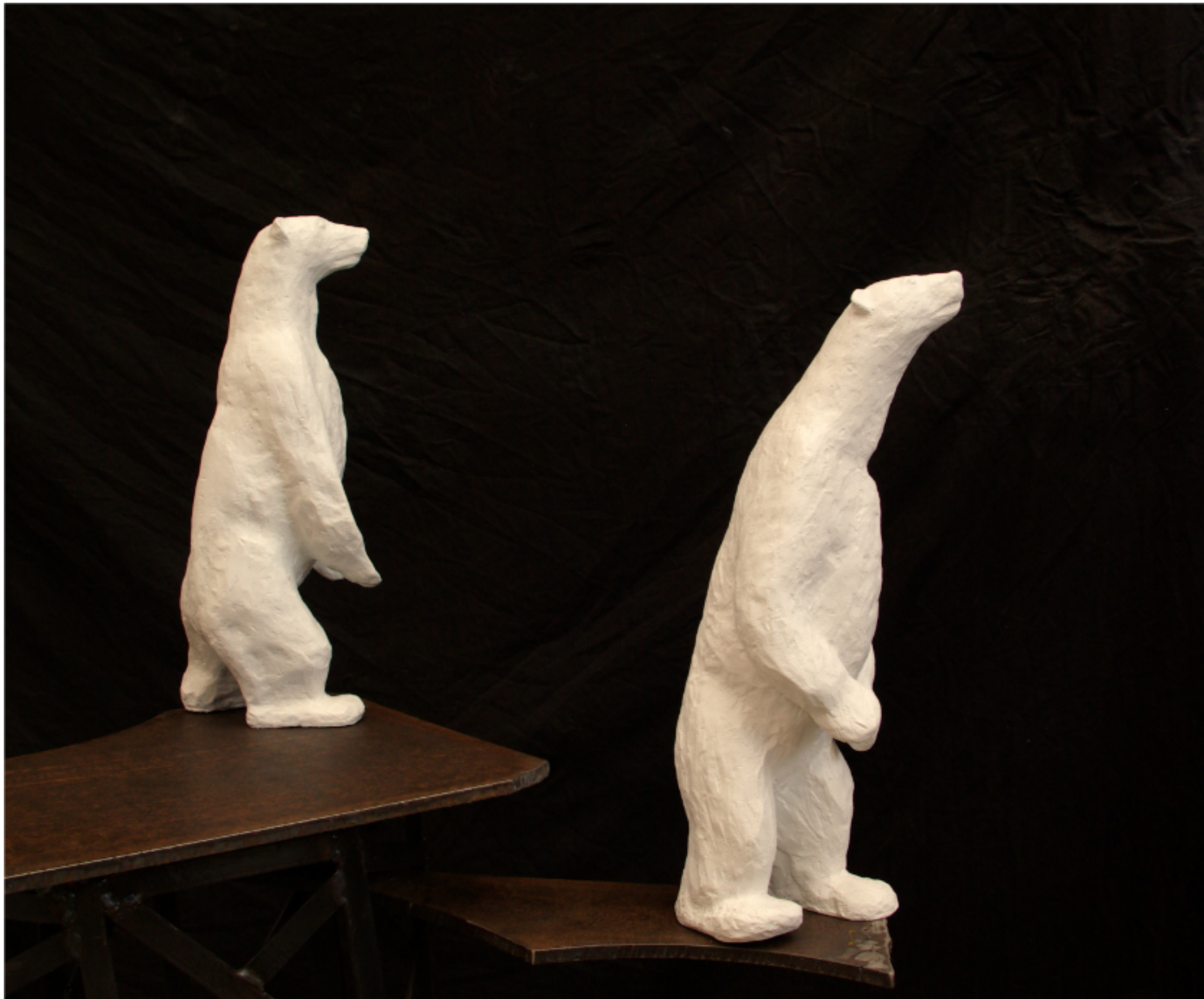
« Ours » Bronze (gauche) 45x19x15cm 1900€