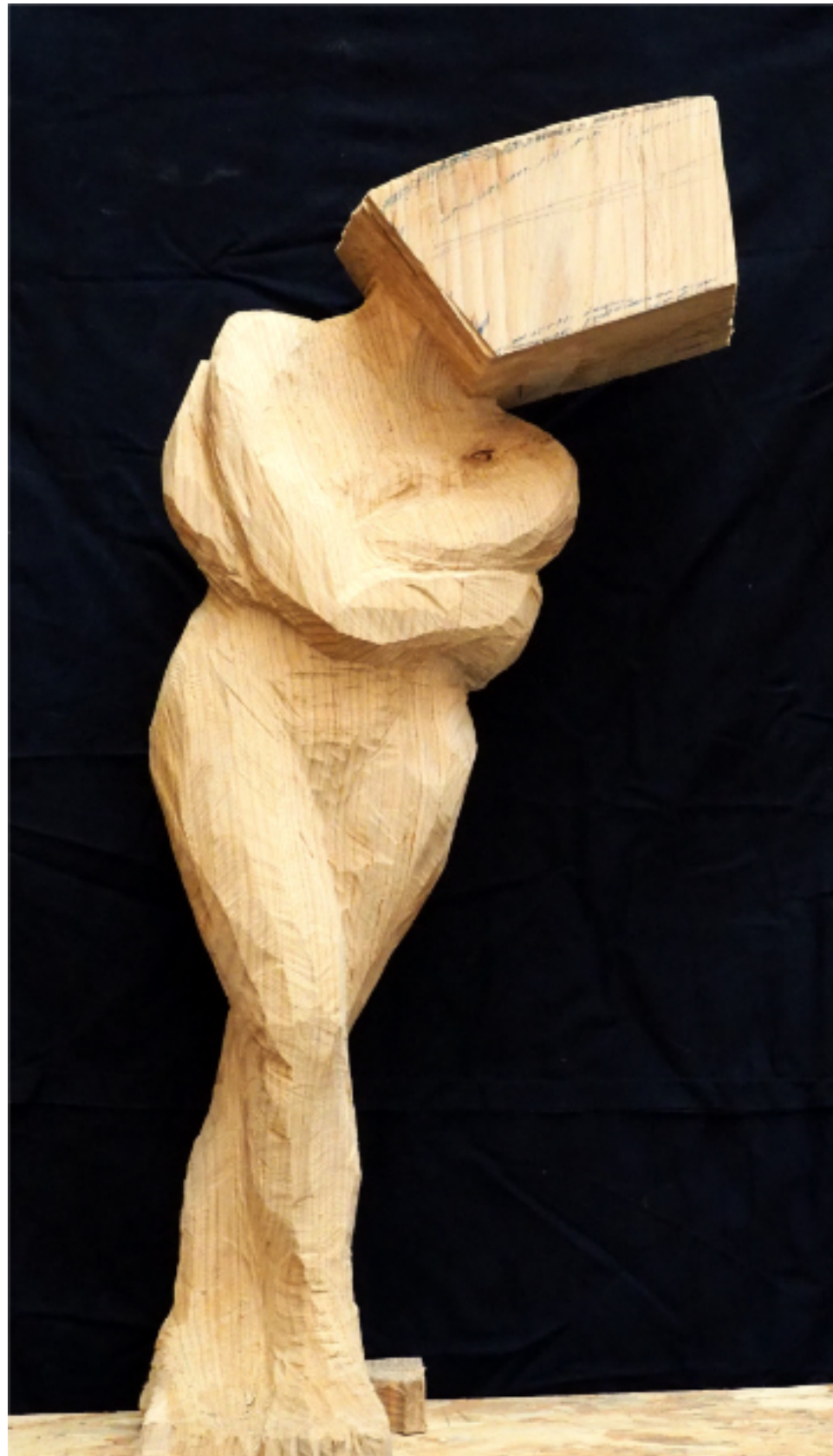
« Mélancolie » cèdre 100x46x23, socle métal 1900€